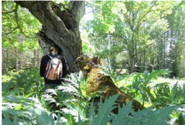
Skogsgruppen inventerar Hemfosa