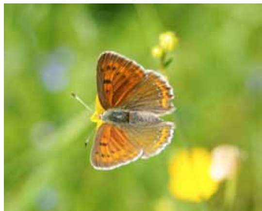
Violettkantad guldvinge