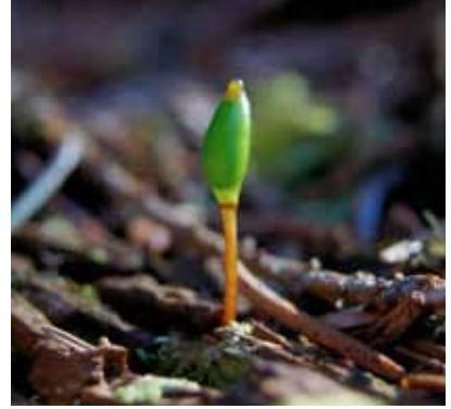
Grön sköldmossa