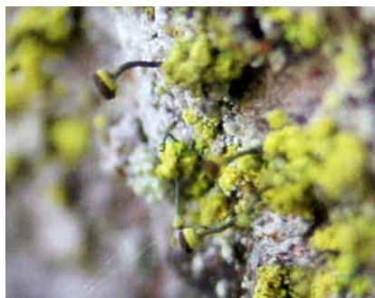
Grynig nållav