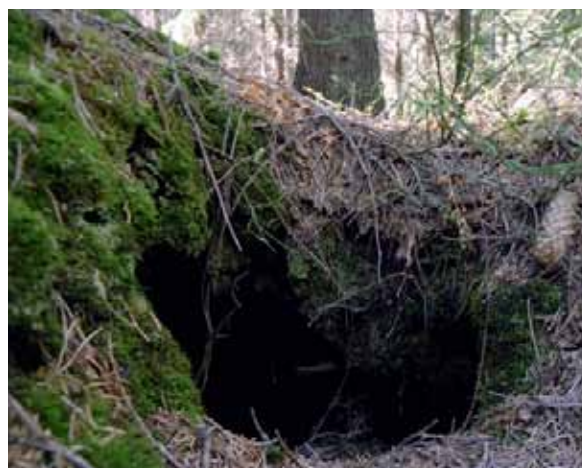
Grävlings- eller rävgryt

Rekreation, eller avkoppling och återhämtning, är viktig för att minska stressnivåerna. I skogsmiljöer sänks pulsen utan att man behöver göra något mer än att bara vara där. Utöver denna hälsohöjande funktion, kan människor motionera eller plocka matsvamp, skåda fågel eller andra populära fritidssysselsättningar.