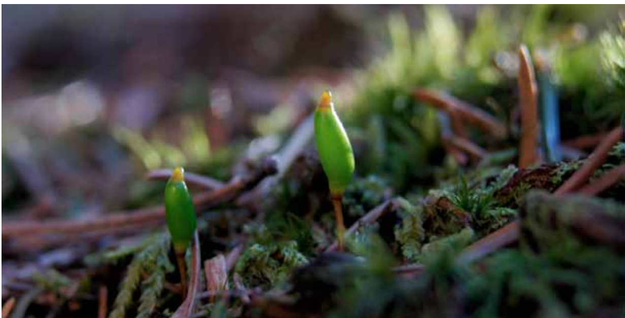
Grön sköldmossa

Korallfingersvampar ( Ramaria ) förekommer även i granskogen och vittnar om att de inte har kalavverkats tidigare. Vid en skogsbäck nära Träsksjön har vi påträffat grön sköldmossa ( Buxbaumia viridis ), vilken är en bra signalart för skogar med en rik tillgång på död ved. Den växer på mycket murkna granlågor och behöver en hög och jämn luftfuktighet för att trivas. Grön sköldmossa är upptagen i EU:s Art- och habitatdirektiv samt i Artskyddsförordningen.