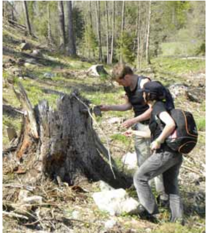
Förstörd naturbäck med dumpat skräp och avverkat naturvärdesträd.

Länsstyrelsen och Haninge kommun pekar på områdets värden för både natur och friluftsliv. Som Länsstyrelsen påpekar i rapporten Strategi för formellt skydd av skog är arealen skyddad skog mycket liten i Hemfosa värde-trakt och man kan här ” forma arbetet med formellt skydd ur ett strategiskt landskapsperspektiv ”. Vi hoppas att denna rapport kan vara till hjälp i det arbetet. Länsstyrelsen pekar just ut granskog och barrsumpskog på bördiga marker som viktiga biotoper att prioritera. Vi kan konstatera att sådana skogar med höga naturvärden finns i Hemfosa-Träsksjön som mycket väl motiverar ett formellt skydd.