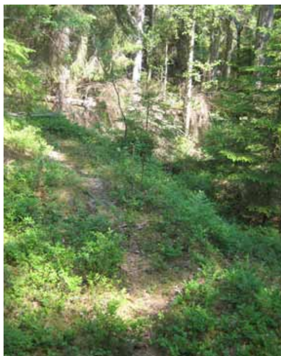
Äldre stig av hålvägstyp