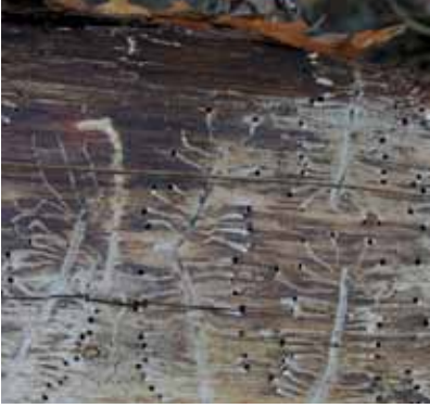
Mindre mörghorre