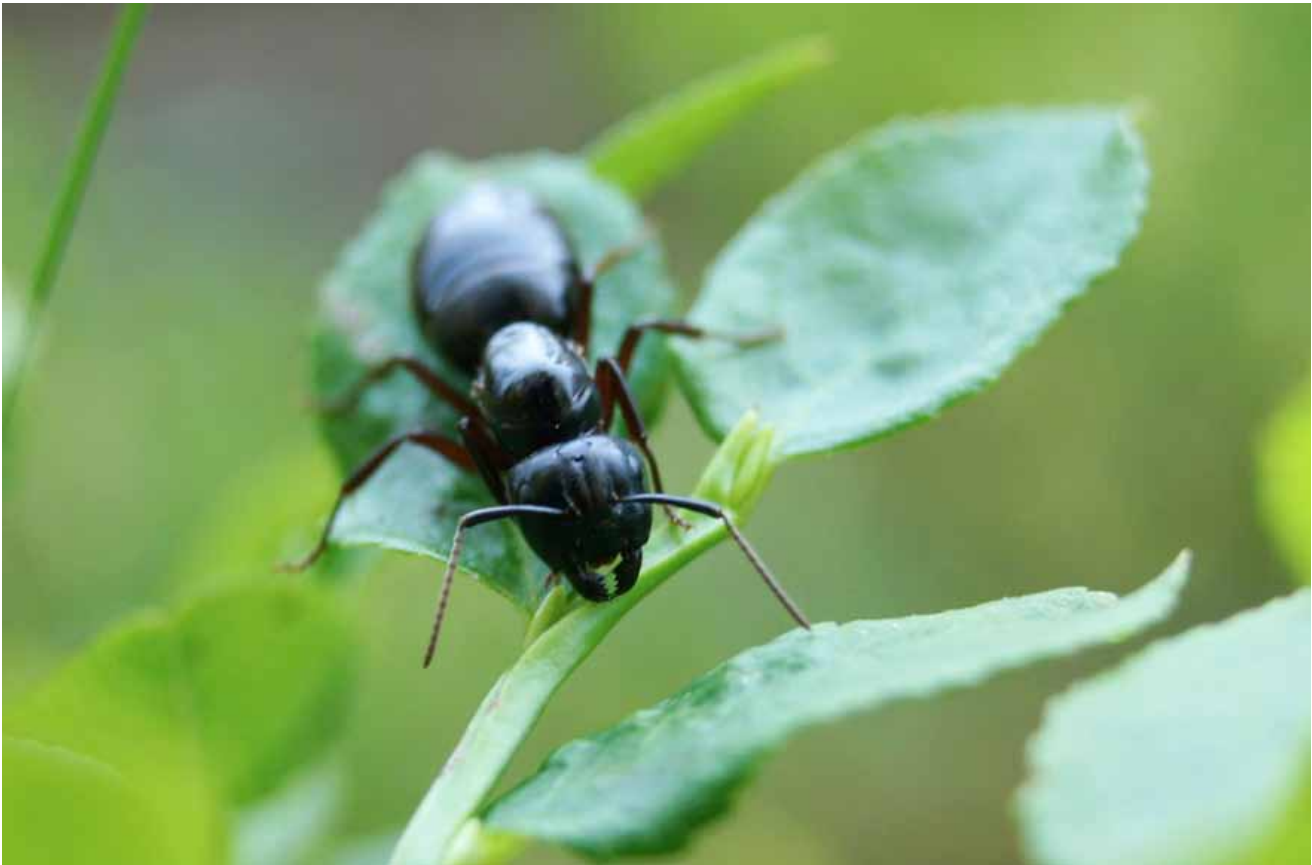
Skogsväktare och blåbärsris