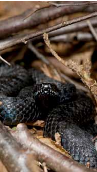
Svart huggorm