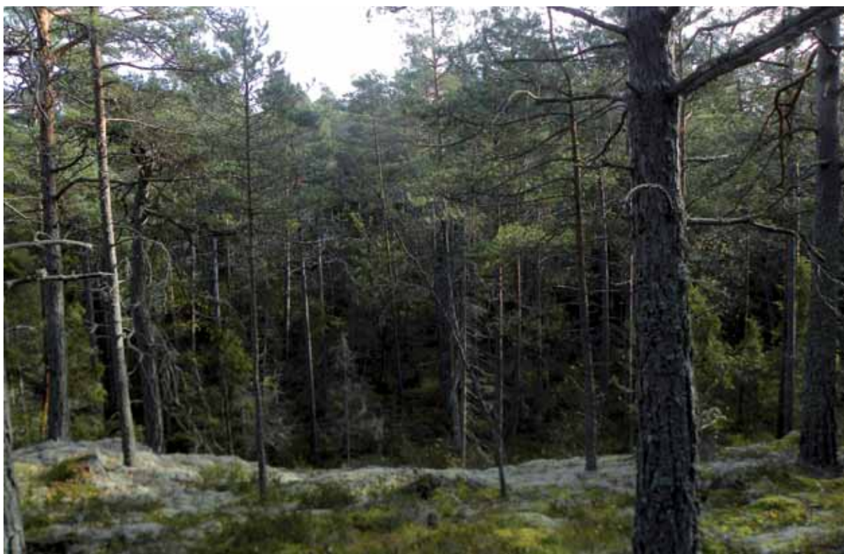
Hällmark och gransänkor