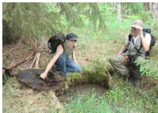
Fynd av kallskälla med groda

En intressant observation var de många kläckhål av bronspraktbagge i byggnadsvirket i det gamla torpet. Bronspraktbaggen är rödlistad som Nära hotad och vars larvutveckling i huvudsak sker i död, torr, barrträdsved och då inte minst i branddödade träd. Men den kanske är mest allmän i gamla heltimrade trähus, kläckhålen kan vara flera decennier gamla men hur det förhåller sig i detta fall vet vi inte. Kläckhålen har nu tagits över av solitära vildbin som utnyttjar dessa som boplatser.