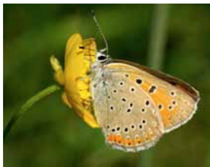
Violettkantad guldvinge