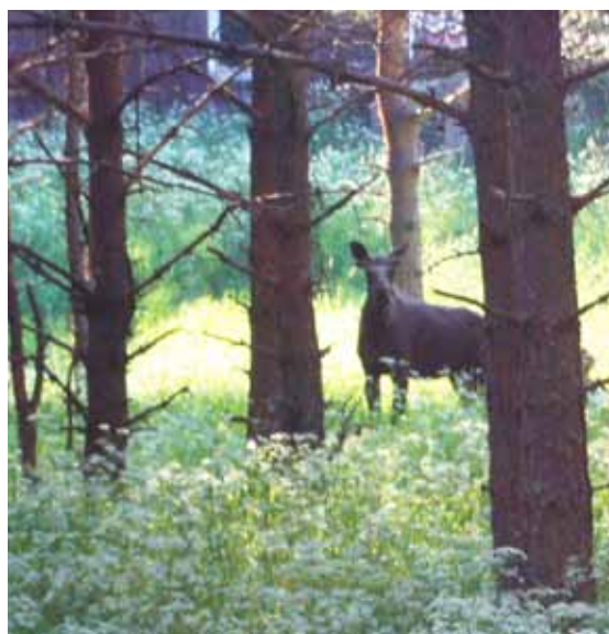
Älg betande på tallplanterad äng