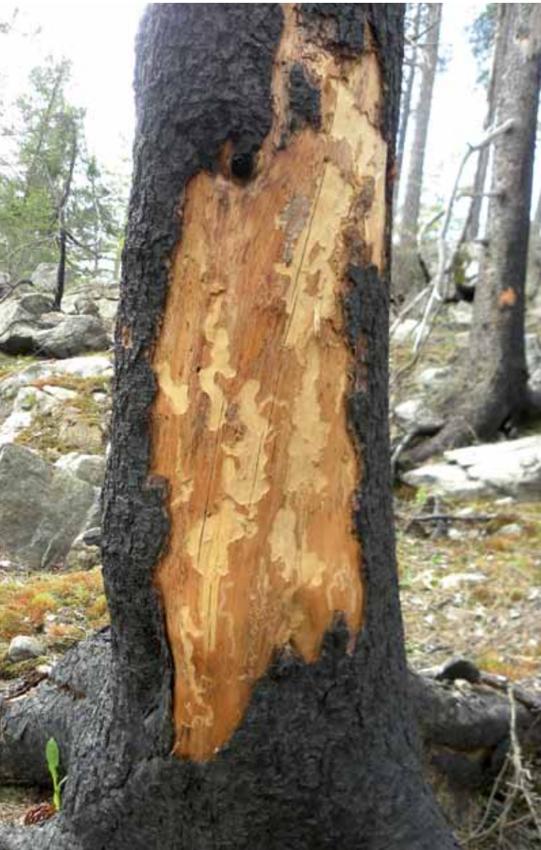
Död ved ger liv

I området vi valt att undersöka finns idag två registrerade nyckelbiotoper samt ett flertal våtmarksobjekt. Vi kan konstatera att det finns fler områden med kvaliteter i nivå med nyckelbiotop eller naturvärde enligt Skogsstyrelsens definitioner. Artfynden tyder på både lång skoglig kontinuitet (korallfingersvamp, koppartaggsvamp, dofttaggsvamp) samt även kontinuitet av död ved (brandticka, kristallticka, grön sköldmossa). På flera ställen tycks det vara mer näringsrika marker vilket indikeras av fynden av taggsvampar och svavelriskar. På dessa ställen finns goda möjligheter att hitta fler ovanliga och krävande arter.