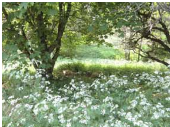
Övervuxen trädgård

Förslag: Anlägg ett stignät kring Träsksjön med grillplatser. Äldre stigar och rösen bör bevaras oavsett om avverkning sker.