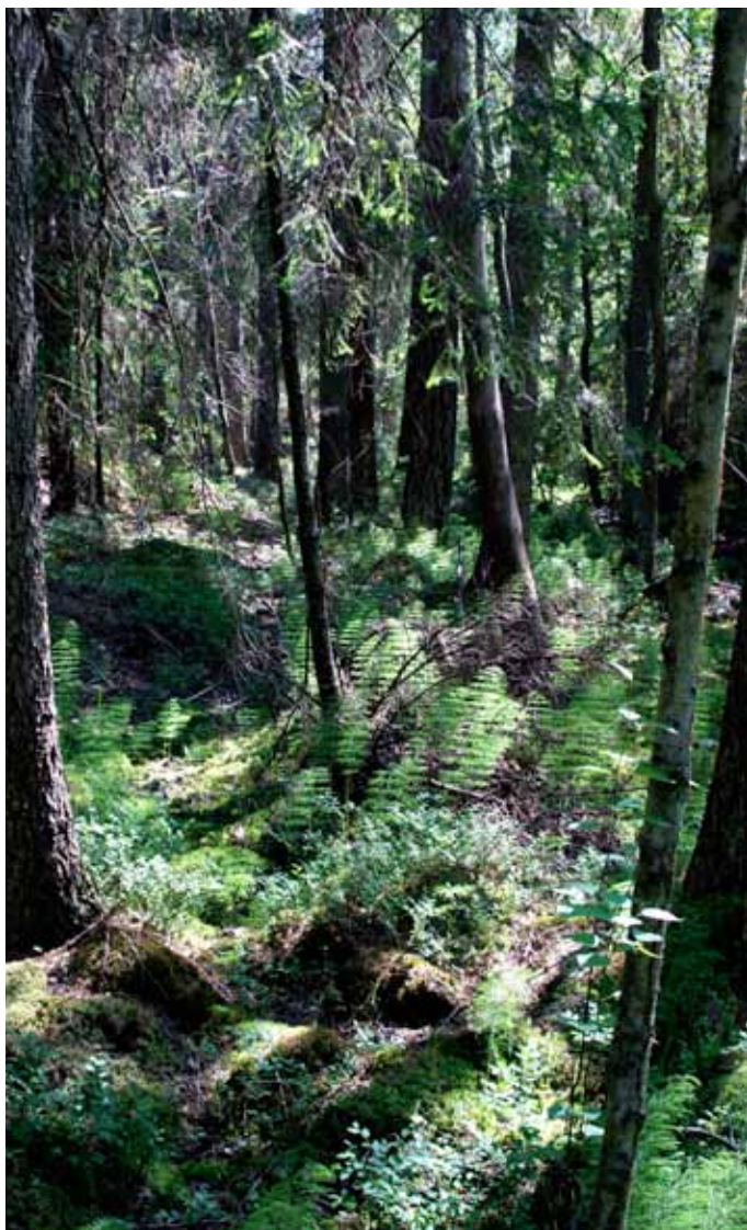
Sumpskog med höga naturvärden

I detta område finns en del hällmarkstallskog med äldre tallar, granskogar med visst inslag av äldre aspar samt mycket fina barrsumpskogar med ytligt grundvatten. Förekomsten av källpraktmossa i en av dessa sumpskogar är ett tydligt tecken på ostörd hydrologi. Här har vi också funnit korallfingersvamp vilket tyder på äldre kontinuitetsskog.