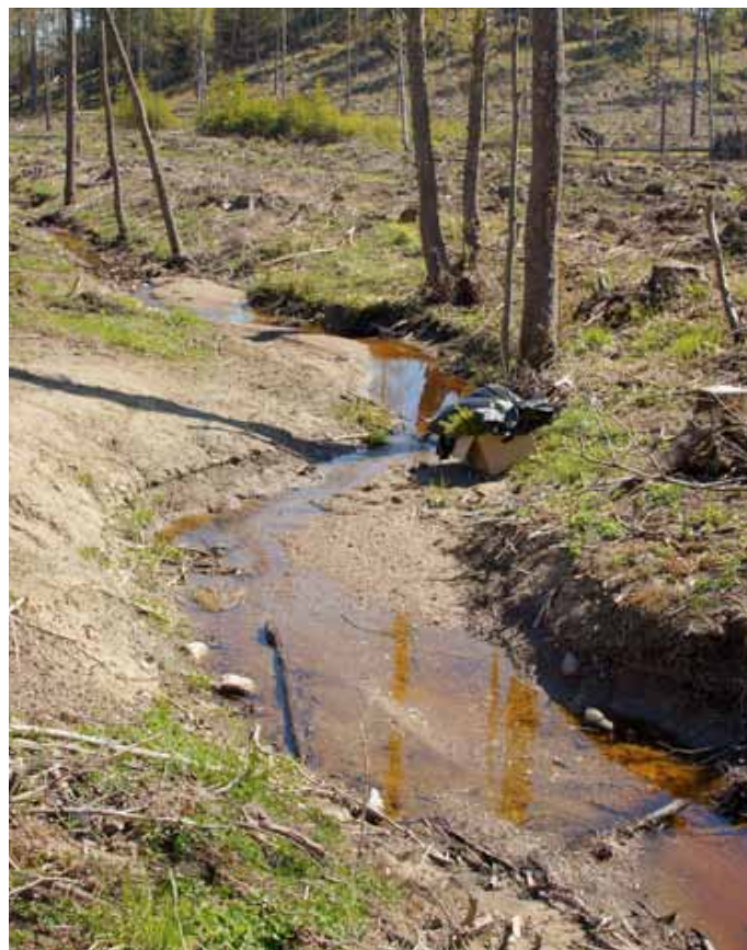
Avverkning omkring naturbäck

Områdena vi undersökt är också fina rekreationsskogar, de många stigarna vittnar om att människor vandrar i skogen här. Men vi ser också att området skulle kunna bli mer känt och utvecklas till ett friluftsbesöksområde.