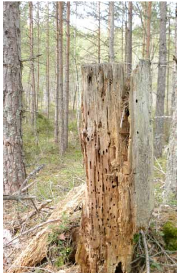
Gamla träd är helt livsavgörande miljö för många arter; torrakor föder en mängd olika vedinsekter; som i sin tur är föda för skogens alla fåglar.