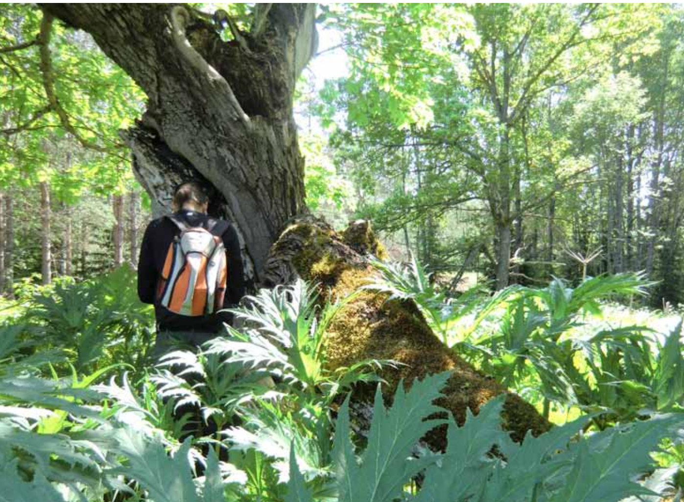
Fina lavar på ett 100-åriga lönträdd vid övervuxet torp

I området finns också en del igenplanterade tidigare öppna marker där vi också gjort en del intressanta fynd av ovanliga arter. Det mest överraskande fyndet var violettekantad guldvinge som vi fann vid det gamla ödatorpet nordost om Hemfosa. Det är en art som vill ha friska (fuktiga) blomrika ängsmarker, gärna med kärrartade marker eller marker med ytligt grundvatten. Ängarna hotas av igenväxning och ändrad markanvändning vilket gör att lämpliga livsmiljöer kraftigt fragmenteras. Markerna runt ödatorpet är i nuläget blomrika och kan kanske utgöra en lämplig livsmiljö för den violettekantade guldvingen under en tid framöver men i takt med att det växer igen kommer den inte längre att kunna leva kvar där. Troligen är förekomsten av violettekantad guldvinge en rest från en tid då landskapet var öppnare än idag och säkerligen starkt betspräglad, vilket även fyndet av kattfot i delområde 2 vittnar om.