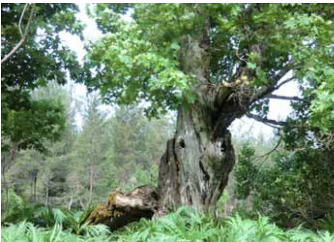
Uråldriga lövträd härbärgerar 1000-tals arter