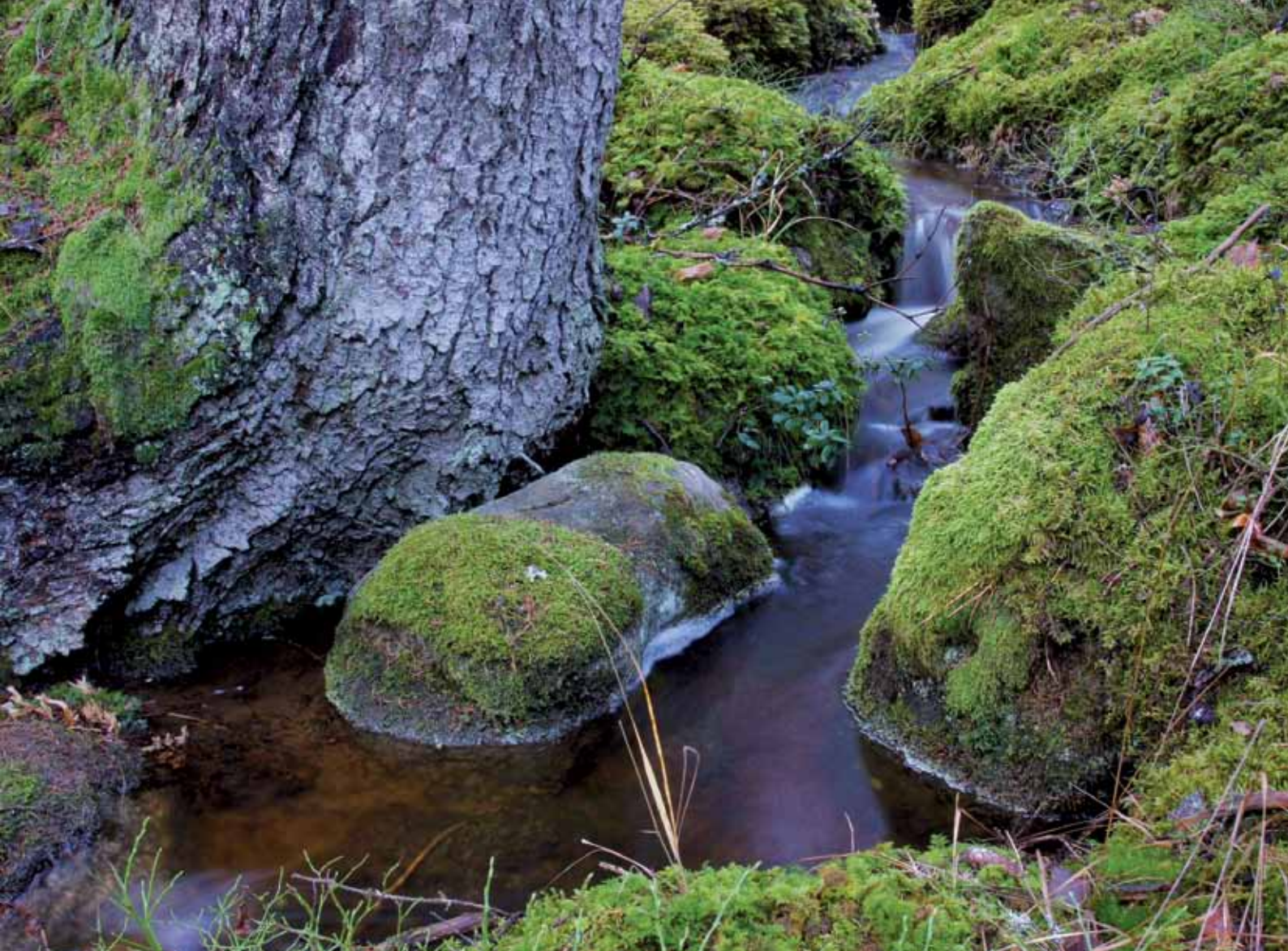
Än porlar bäcken vidare

Andra intressanta arter som vi observerat är göktyta, som vi hörde sjunga i området kring ödatorpet. Den är rödlistad som Nära hotad och behöver ett öppet landskap med gamla lövträd där den kan finna lämpliga bohål. Den lever huvudsakligen av små marklevande myror vilka inte överlever om markerna växer igen för mycket. Att betes- och hagmarker planteras och växer igen är ett hot mot arten då förutsättningarna för marklevande myror då kraftigt försämras.