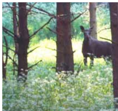
Älg och kirska