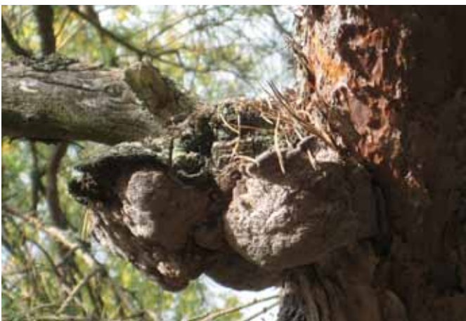
Talltickan behöver 150-åriga tallar