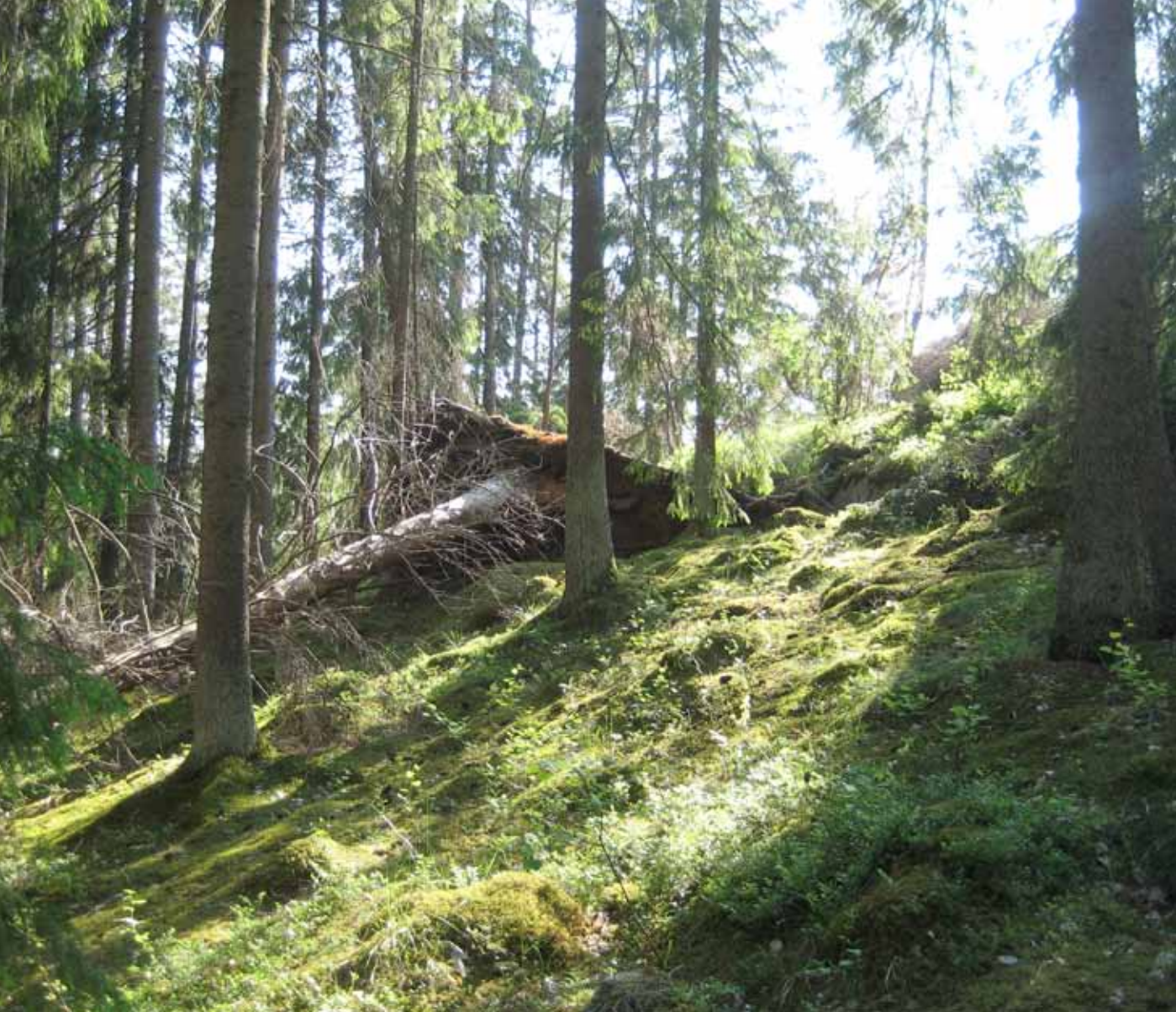
Hemfosa skogsmark